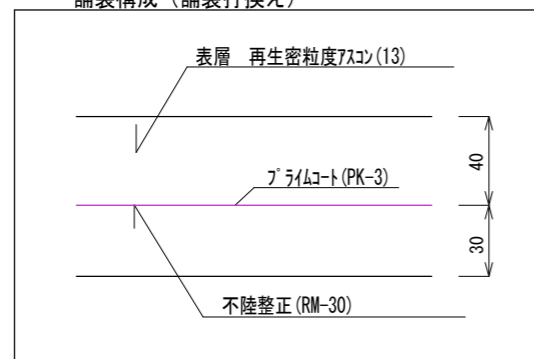
舗装構成 (舗装打換え)