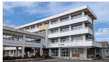
改修を実施する鴨島第一中学校

【新規】 鴨島地区中学校統合校舎改修事業 令和7年度3月補正分 1億8,921万3千円 令和8年度当初予算分 668万7千円 令和7年度3月補正予算と合わせて国庫補助金などを活用し、令和9年4月の鴨島地区中学校統合に向けて、既存校舎の改修を行います。