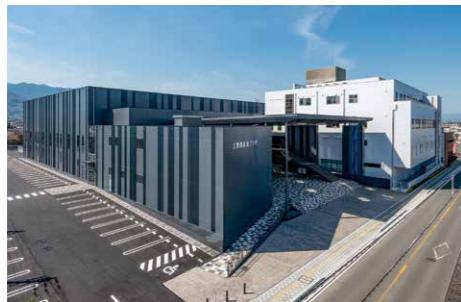
日本フネン市民プラザ

【新規】 市民プラザ駐車場拡張工事 506万7千円 市民プラザ南側隣接地を造成し、駐車可能台数を増やします。