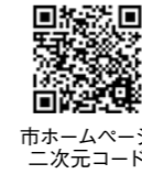
市ホームページ 二次元コード

※転飼とは、飼育する土地を変えながら蜜を採ったり、越冬させる飼育方法です。 ※年の途中で新たに飼育を開始した場合は、随時受付をしています。