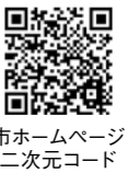
市ホームページ 二次元コード