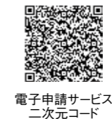
電子申請サービス 二次元コード