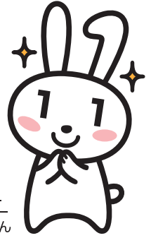
マイナンバー PRキャラクター マイナちゃん