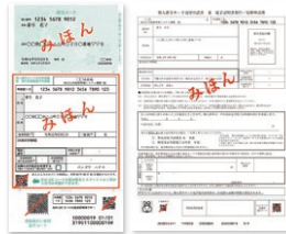
マイナンバーカード交付申請書