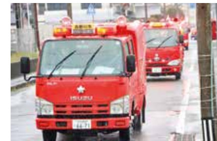
△防火パレードに出動する消防車

119番の日である11月9日から1週間、「秋季全国火災予防運動」が実施されました。本市では、11月10日に市消防団・徳島中央広域連合消防本部・阿波吉野川警察署合同による防火パレードを市内全域で実施しました。