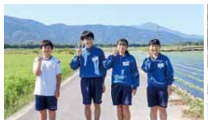
△市立川島中学校の皆さん

10月、11月に市立川島中学校から4名、鴨島第一中学校から6名、鴨島東中学校から2名が市役所で職場体験学習を行いました。中学生らは、広報広聴係の仕事のほか生活あんしん課や商工観光課での業務を体験しました。広報広聴係では撮影に同行し、吉野川の風景や菊人形、コスモスなどを撮影しました。