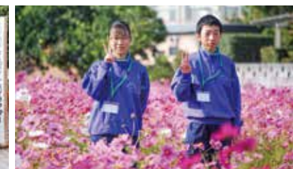
△鴨島東中学校の皆さん