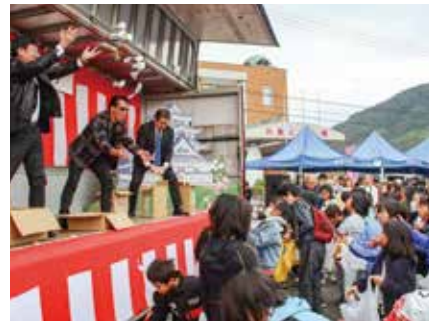
△ふるさと祭り名物 餅投げ!

11月12日、川島体育館の駐車場など周辺一帯で「第4回川島ふるさと祭り」(川島ふるさと祭り実行委員会かわしま未来塾主催)が開催されました。会場では、キッチンカーや地元特産品販売を始め、働く車やスーパーカーの展示が行われ、多くの家族連れらで賑わいました。また、ステージでは地元小中学生による演奏やリーゼント刑事のトークショーなど多数のイベントが行われたほか、ふるさと祭り名物の餅投げでは、老若男女問わず熱狂している様子も見られ、イベントは大盛況のうちに幕を閉じました。