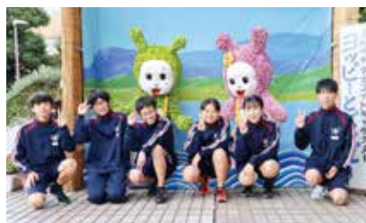
△鴨島第一中学校の皆さん