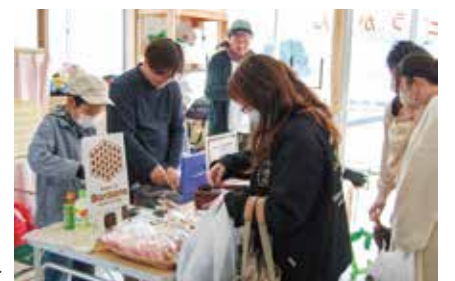
子どもインターンシップの様子▷

11月18日、鴨島児童館で「もぐもぐフェスタ」が開催され、多くの人で賑わいました。会場では、おにぎりやスイーツなどを児童館価格の300円以下で販売し、オープン早々に売り切れる商品もありました。また、子どもインターンシップを同時開催しており、子どもたちが実際にお店に立ち、販売のお手伝いをしました。