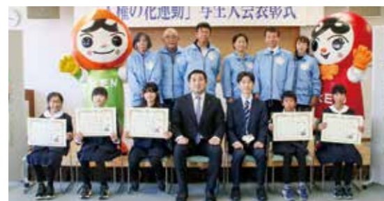
鴨島小学校の皆さん