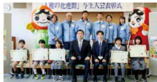
飯尾敷地小学校の皆さん