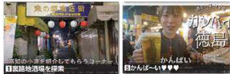
人気Youtuberが徳島の酒場を紹介するショート動画 R5.6時点で20.4万PV