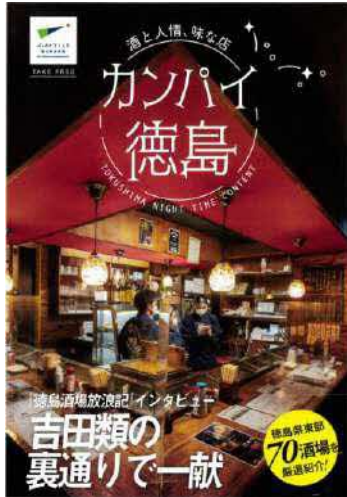
宿泊施設や観光施設で配布する小冊子