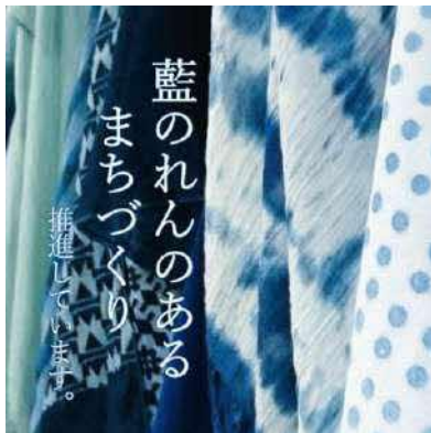
徳島東部圏域の13の工房がのれんを制作

阿波藍染めの振興と徳島らしさを感じられる魅力的なまちづくりを推進するための助成制度 令和4年度は36店舗の飲食店が藍のれんを制作 ※令和3年度から累計で72件