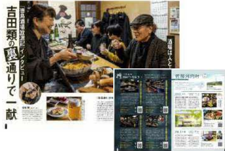
ターゲット層に訴求力のある吉田類氏を起用