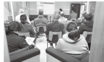
コワーキングエリアでの起業家セミナー例

Zoomでの情報発信やZoomでのWeb会議などの場としてKi-Daを提供します!