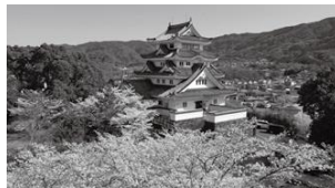
川島城ライトアップ事業