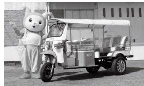
カーボンニュートラル時代を見据えた地方の二次交通の推進と中心市街地の活性化