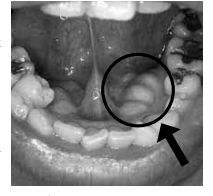
下あごの内側に見られる骨隆起複数に分かれて見える場合もある

質問 この前、歯磨きをしていたら、ふと下あごの内側に大きな膨らみに気づき、それ以降、気になります。触れると硬いのですがこれは悪いものではないでしょうか。 回答 ご質問の内容から、これは骨隆起と言われる顎の骨の隆起したものと想われます。ごく最近、気付かれたとのことですが、おそらく何年も前からお口の中にあったものと思われま。 原因として一般的に考えられているのが、過剰な噛み締めやくいしばり、歯ぎしりに対する顎の骨の反応と言われています。骨にこのような癖があると、顎の骨には強大な力がかかるため、顎も折れないように骨を膨らませ、補強すると言われてます。 よくできやすい場所としてはご質問にあった、下あごの内側や、上下奥歯の外側の骨のところにできたりすることもあります(下図参照)。 一度できた骨隆起は小さくなることはなく、原因である歯ぎしりなどの癖が改善され