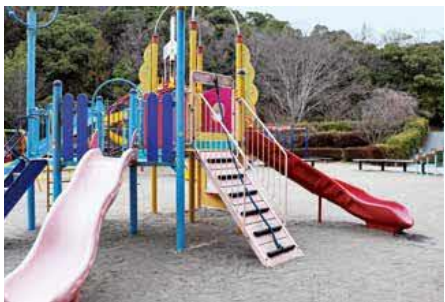
△修繕されたスベースランド

公益社団法人ライフスポーツ財団の「子ども活動支援補助金」(コロナ禍における子どもたちの健全な心身の育成に寄与する取り組みを行う市町村に対し支給されるもの)を活用して、向麻山公園の大型複合遊具を修繕しました。公益社団法人ライフスポーツ財団は、幼児や子どもたちが身近に、積極的に体を動かせるようにと、誰でも参加できるスポーツ活動の支援に取り組んでいる財団です。本市の向麻山公園に設置されている大型複合遊具などを修繕することで、より安全に遊ぶことができ、体を思い切り動かすことで子どもたちの健全な心身の育成を図ります。