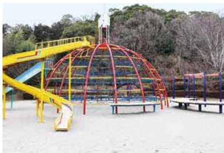
△修繕された大型複合遊具