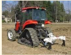
【例】排水対策（明渠、暗渠）