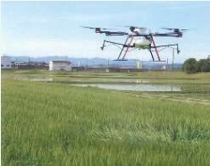
【例】スマート農業機器の活用