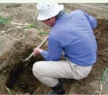
土壌診断に基づく施肥