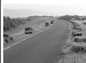
刈草の仮置き状況

吉野川の堤防除草で発生した刈草を堤防付近や集積場所に置いてあります。提供条件や設置時期など詳細は問い合わせください。