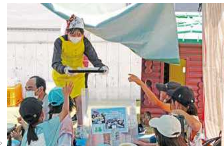
配膳を行う高校生と参加した子どもら

5月29日、地域特産品の販売などを手掛ける川島町の合同会社川島えがお倶楽部が、本市で初めての子ども食堂「川島えがお食堂」を同町菜村のかもめスイミングスクール敷地内の芝生広場で開催し、カレーライスや焼きトウモロコシなどを振る舞いました。川島高校の生徒約40人もボランティアで参加し受付や配膳を行いました。