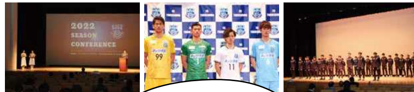
△2022年FC徳島新体制発表会

●問い合わせ 健康推進課 新型コロナワクチン担当 ☎36-1177 FAX22-2260