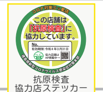
抗原検査 協力店ステッカー

「ガイドライン実践店ステッカー」及び「とくしまコロナお知らせシステム」に 登録済みの飲食店及び宿泊施設は、県に申請していただければ、 従業員の体調不良時に使用できる「抗原検査キット」を配布します。