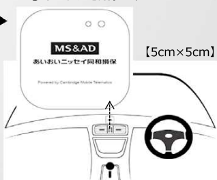
安全運転のヒント