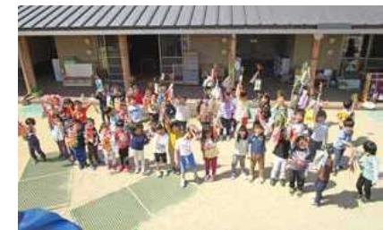
△かざぐるままで元気に遊ぶ高越こども園の園児

今年も514人の子どもたちに届きました。園庭では、子どもたちが、かざぐるまを使ったこいのぼりを手に、元氣よく風に泳がせて楽しみました。