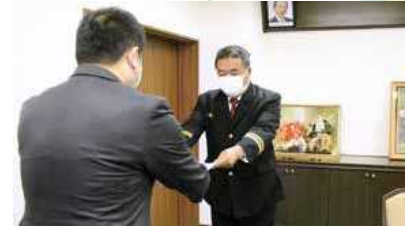
△新しい消防団長に辞令書を交付

令和3年度から団長、副団長、分団長になられたのは次の方々です(順不同、敬称略)。