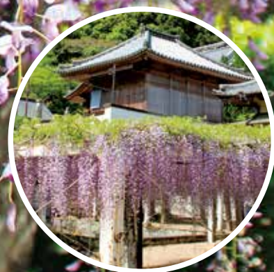
藤井寺のフジ 撮影日：令和3年4月22日