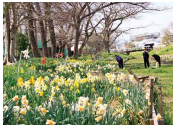
かれんな花を咲かせ、江川沿いを彩るスイセン