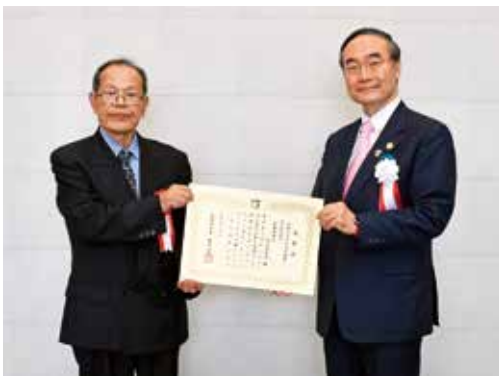
△地域の防災力向上に貢献