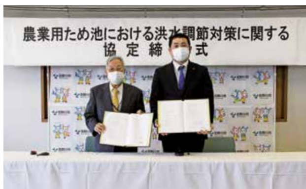
対策に関する協定締結式