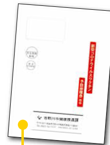
このような封筒(A4白)で送付します。