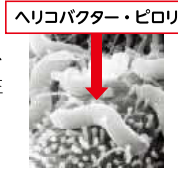
ヘリコバクター・ピロリ