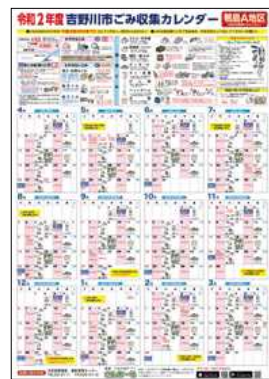
写真は令和2年度(鴨島A地区)のもの

令和3年度ごみ収集カレンダーは2月24日(木)から自治会を通じて配布予定です。自治会未加入世帯には3月中旬に送付予定です。