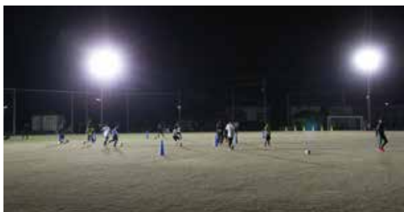
岡原多目的緑地公園

平成27年度に完成した岡原多目的緑地公園（鴨島町山路）に照明設備が新設されました。