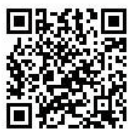
登録用 QR コード

※完了のメールが届かない方は、「mail@city.yoshinogawa.lg.jp」からのメールを受信できるように、携帯電話などの設定を行ってください。登録無料ですが、メール受信にかかる通信料は個人負担となります。