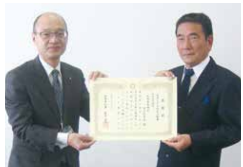
△地域の防災力向上に貢献

受賞した知恵島西地区自主防災会は、知恵島小学校と合同で防災訓練を開催し、子どもを含めた地域の防災力向上に貢献しており、人文字など工夫を凝らした訓練を実施していること、また、地元企業と『災害に強いまちづくり応援協定』を締結するなど、特色のある活動が評価されました。