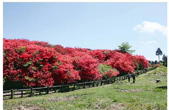
船窪のオンツツジ群落 (国指定天然記念物)