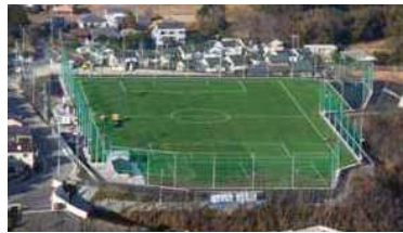
完成間近となった多目的グラウンド

上桜温泉・中央美化センター跡地を整備した吉野川市多目的グラウンドが3月末日に完成します。