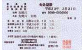
新しい国民健康保険証の見た