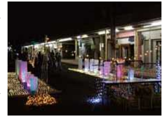
LED電飾を使用し商店街を装飾

● 市民の自発的な地域活性化の取り組み 10月27日、廃校となった美郷郷種野小学校で「第1回みんなの文化祭」、鴨島駅前周辺で「わざわざ鴨島駅前に行こう！」が地元住民有志により開催されました。今までにない新しい取り組みに、各会場とも大いに盛り上がりました。 また、11月11日には、川島体育館駐車場をメイン会場に「川島ふるさと祭り」が、地元住民有志により復活しました。 いずれも、自発的な市民の取り組みであり、このような行事が定着するよう地域住民の自主的な取り組みを大切に、地域の活性化につなげていきたいと考えています。