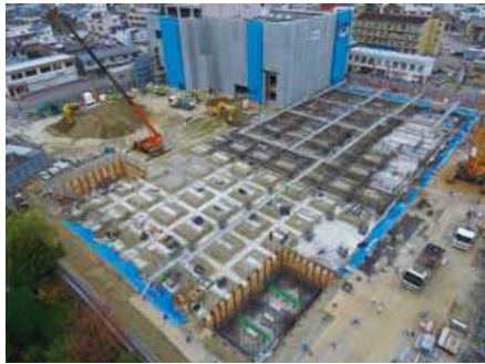
11月下旬の建設現場

地域の皆様のご理解、ご協力のおかげもあり、工事は順調に予定通り進んでいます。今後もより一層のご協力をお願いします。