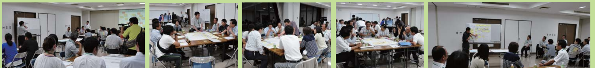
ワークショップの説明を聞いています！