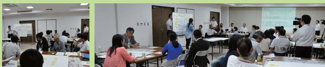
発表を聞いています！