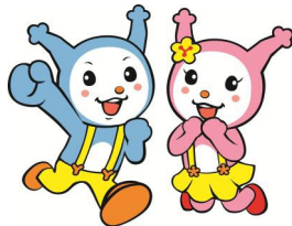
吉野川市公式キャラクター ヨッピー・ピッピー

企業立地促進奨励金については最大5年間交付期間があるため、『④奨励金交付申請書～⑦奨励金交付』を毎年固定資産税完納確認後、行います。 ※毎年1月1日時点に確認 ※雇用奨励金については1回限り