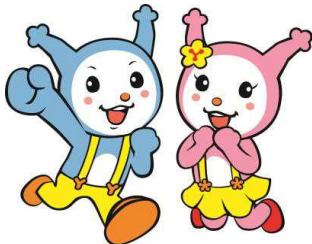
吉野川市公式キャラクター ヨッピー・ピッピー

企業立地促進奨励金については最大5年間交付期間があるため、『④奨励金交付申請書～⑦奨励金交付』を毎年固定資産税完納確認後、行います。 ※毎年1月1日時点に確認 ※雇用奨励金については1回限り