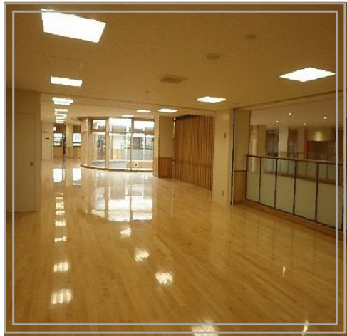
(上) オープンスペース