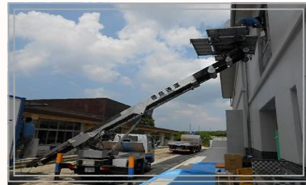
徳島通運株式会社による移転作業の様子