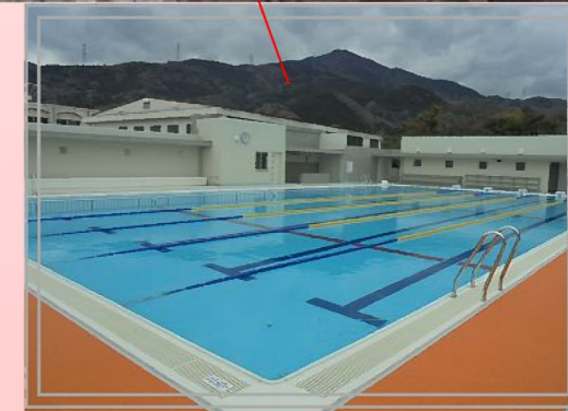
(右写真) 小プール2コース、大プールは5コースの25mプール。

平成29年3月31日高越小学校(仮称)のプールが完成しました!今年の夏は川田中小学校の児童がこのプールを使って、水泳学習を行います。