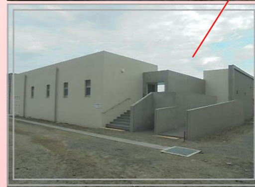
(左写真) スロープが付いたバリアフリーのプール棟入口。