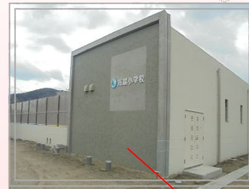
(右写真) 校名と校章が入った、モダンな造りのプール棟。