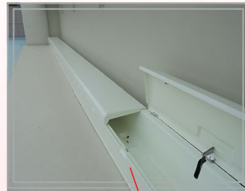
(左写真) コースロープの収納を兼ね備えた座席シート。