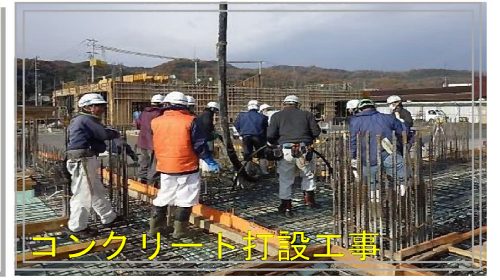
コンクリート打設工事

1階部分、土の上に直接コンクリートを打設することを「土間コンクリート」というんだよ！