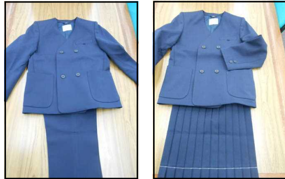
※標準服のイメージ

標準服のベースは、(上)は紺色のイートンジャケット(ダブルボタン)、(下)は紺色のズボンやスカートとします。これは現在川田小学校・川田西小学校・種野小学校が使用しているものと同じになります。装飾品(ボタン・ワッパンの有無)など、詳細部分について今後保護者の皆様にアンケートを取りながら、引き続き検討を重ねていきます。