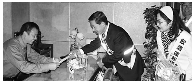
飲食店をめぐり、飲酒運転撲滅を呼びかける川真田市長(中央)

飲酒運転撲滅キャンペーン実施中の12月13日、鴨島町文楽通りの飲食店30カ所を吉野川市長をはじめとして、吉野川警察署長、交通安全関係団体の長、市職員など20人が訪問しました。「しない・させない・許さない 飲酒運転」と書かれたのぼりを手に、飲食店の店主に飲酒運転ゼロ宣言のチラシや反射材グッズを手渡し、飲酒運転追放と安全運転を呼びかけました。