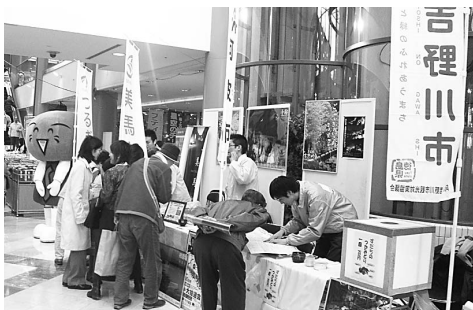
フジグラン松山では写真やポスターで吉野川市をPR

この日は、多くの人でにぎわうなか、協議会が作成したパンフレット3000部、梅干し、とら巻きのサンプル品を配布し、阿波市・吉野川市のPRをしました。