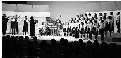
観客の満員が共演の行事な合奏団の小学生と魅了しました

12月15日、鴨島公民館で、ブラハ・バロック合奏団による吉野川市民コンサートが開催されました。