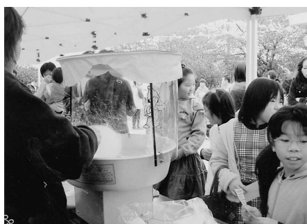
露店のおかしは大人気でした