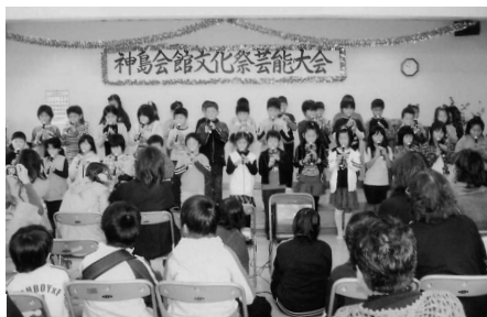
小学生による発表

今年で25回目となる文化祭は、教育文化の向上を図ることを目的に、諸活動を発表したり、近隣地域住民と交流したりして、毎年実施されています。