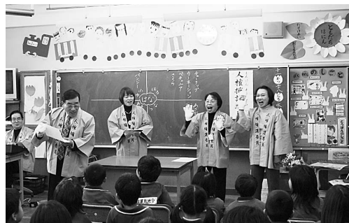
人形劇を演じる人権擁護委員

手作りの指人形を使って人権劇を演じたり、児童と一緒に歌を歌ったりして、人権について楽しく考える時間を過ごすとともに、人権擁護委員は子どもにとっても身近な相談員であることを伝えることができました。