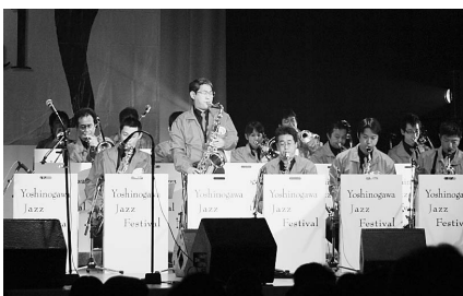
吉野川ジャズフェスティバルでは、県内外13団体のバンドが会場を大いに盛り上げました

奏を市民の皆さんに身近に楽しんでいたとともに、地域の活性化と文化の発展に十分な成果が挙げられたものと考えています。