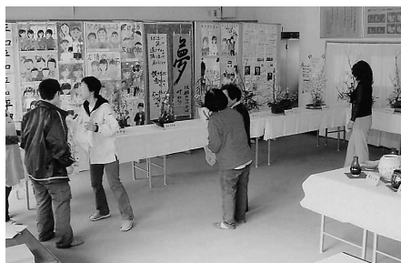
力作ぞろいの展示会場では、参加者が熱心に作品を鑑賞していました

した。展示会では、生け花・陶芸各教室の講師・受講生や、小・中学生たちの作品が展示されました。