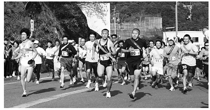
スタートと同時に勢いよく駆け出すランナーたち

12月2日、美郷地区をコースとした第31回美郷一周駅伝大会(美郷一周駅伝実行委員会主催・6区間20km)が開催されました。