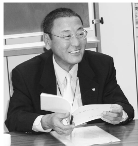
の 野 修 二 貞