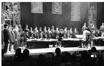
吉野川文化探訪フェスティバルでは、市内の小学生と徳島邦楽集団による歌の合同演奏なども行われました

ジャズフェスティバル」を開催しました。「吉野川文化探訪フェスティバル」には約800人の方々に、「吉野川ジャズフェスティバル」には全国各地からの出演者を含め、約1500人の方々に参加をいただきました。ダイナミックなジャズと優雅な邦楽の演