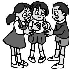
「ぶんげい麻植」第2号より

新年あけましておめでとう ございます。児童生徒の皆さんは、夢や希望に満ちた新年を迎えたことと思います。この1年を自らの飛躍の年にしましょう。