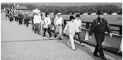
秋空の下、ウオークを楽しみました

11月18日、バンブーパークで、第3回こうつウオークin吉野川が開催され、約400人が参加し、13kmのコースを元気に歩きました。今年は、阿波忌部氏にスポットをあて、岩戸神社や忌部神社に立ち寄り、歴史の重みを感じながら散策しました。ウオーク終了後には、会場でお楽しみ抽選会や物産の展示が行われ、参加者は楽しいひとときを過ごしました。