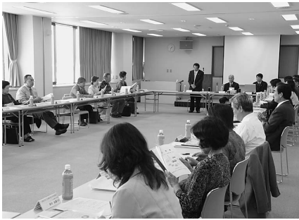
吉野川市のごみ処理問題を考える市民会議

今後、この提言書を踏まえ、ごみの減量化、資源ごみのリサイクル、収集体制の統一化等に向け、できるところから着手していきたいと考えています。