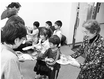
収穫祭を紹介した塗り絵のカードと果物を手渡す園児たち

11月9日、めぐみ幼稚園の園児たちが市役所を訪れ、市長をはじめ日ごろお世話になっている方々に、カキやミカンなどの果物を贈りました。園では毎年収穫祭を祝い、日ごろの感謝の心を込めて果物のプレゼントをしています。