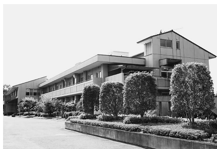
指定管理候補者が選定された、養護老人ホーム「芳越荘」

養護老人ホーム「芳越荘」については、平成20年度から指定管理に移行するため、諸準備を進めてきました。先日、指定管理者選定委員会における審査の結果、指定管理候補者が選定されました。