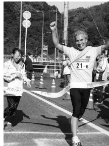
ガッツポーズでゴール!