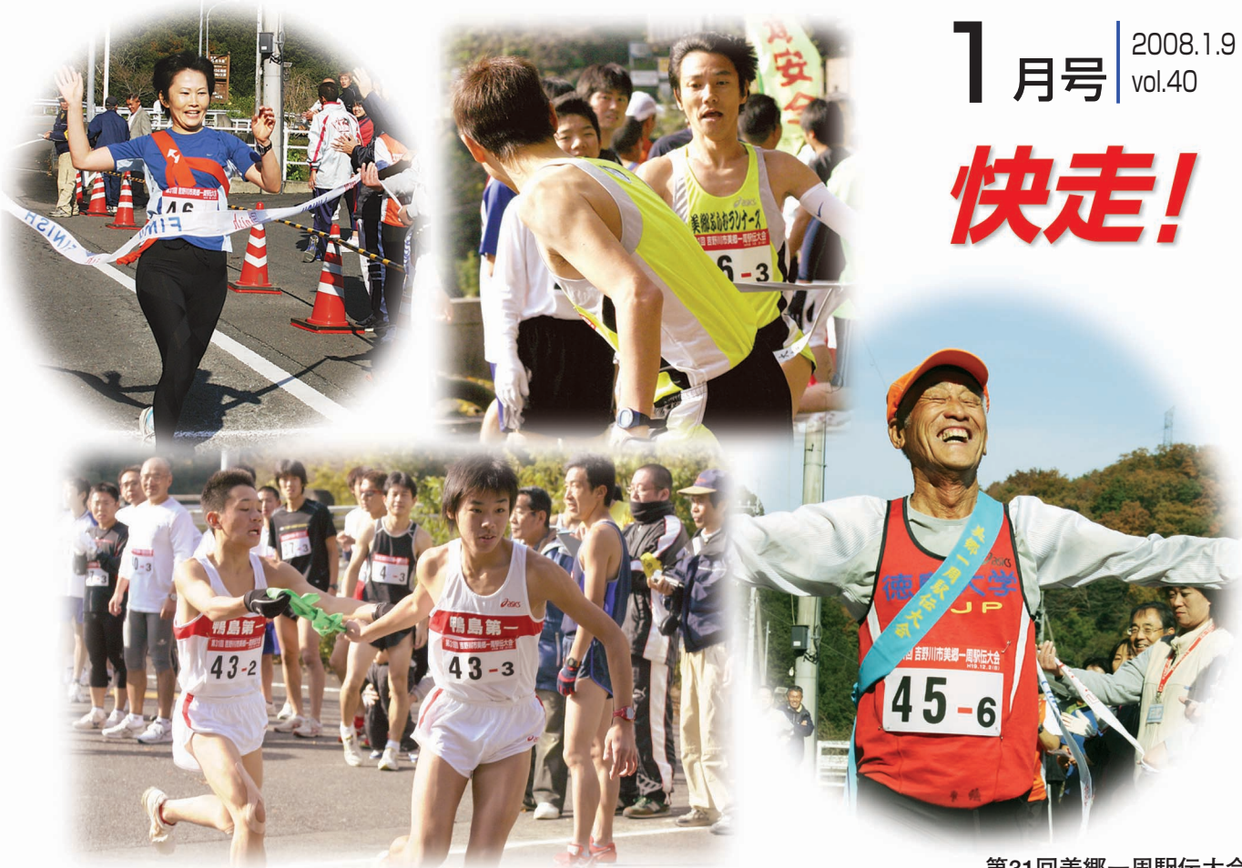
第31回美郷一周駅伝大会