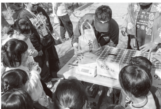
体験型イベント（お米まつり）

ふるさと納税支援業務委託事業者の株式会社パンクチュアルと連携し、前向きに取り組む。