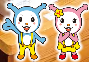
吉野川市公式キャラクター ヨッピー・ピッピー