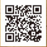
議会HPは こちらから確認!