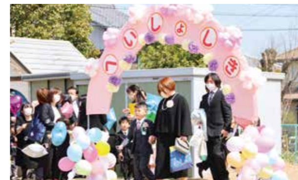
△花道を歩き保育所を後にする園児ら

閉所式では、0～5歳児の在園児27名に保育証書が手渡された後、園庭に設けられた花道を園児と保護者が手をつないで歩き、職員らに拍手で見送られながら保育所に別れを告げました。