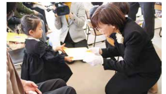
△保育証書が手渡されました