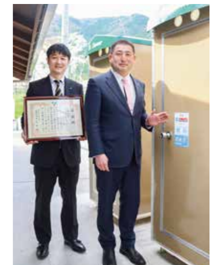
△寄贈されたシャワーユニット