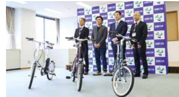
△一般社団法人kittamu様のご厚意に感謝いたします

3月25日、一般社団法人 kittamu 様から、電動アシスト自転車3台を本市へ寄贈していただきました。電動アシスト自転車については、ガバメントクラウドファンディング®を活用したカーボンニュートラル時代を見据えた地方の二次交通の推進および中心市街地活性化の事業の一環として整備するにあたり、本寄贈の提案をいただいたものです。