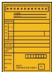
（新しい被保険者証） 有効期限 令和3年7月31日