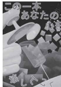
県立川島中 中尾 優花