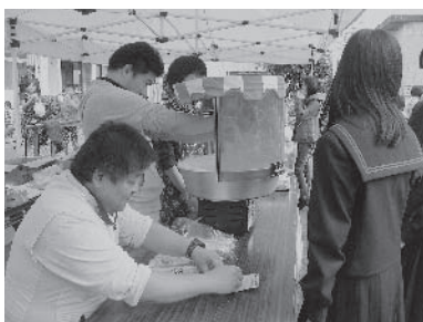
神島文化祭の様子

人権学習会では、これからもさまざまな活動を行い、人権の大切さを学び、差別解消への実践力を養っていきます。今後も皆様のご理解とご協力をお願いします。