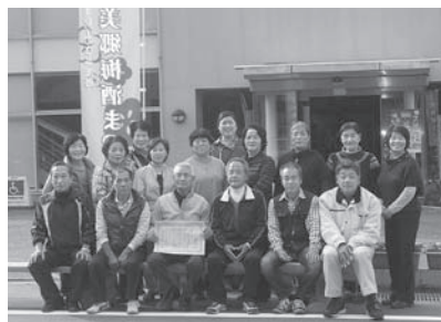
美郷宝さがし探検隊の皆さん

特定非営利活動法人美郷宝さがし探検隊が、「デイスカパー農山漁村(むら)の宝」(第2回選定)の優良事例として選定されました。