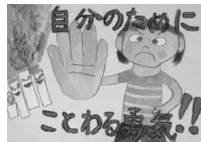
鴨島小 上藤 幸歩