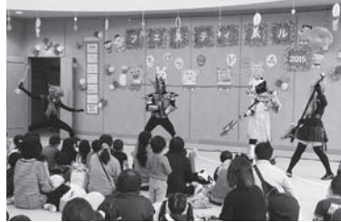
ヒーローショーに釘付け!!

11月14日、吉野川市子育て応援団により「ちびっこだームフェスティバル2015」が開催されました。今回は、スタッフ全員が仮装をして来場者を出迎えました。