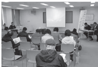
市役所での開催風景

11月26日市役所大会議室で、27日に山川公民館で介護予防講演会を開催しました。