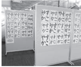
市役所(東館)での書道展示

児童虐待が疑われるような通報や相談があった場合には、子どもと安全確認と家族との面談を行っています。