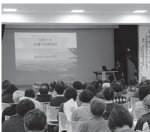
山川公民館での開催風景

各イベント会場では、梅酒を飲み比べたり、梅酒以外にも各所自慢の手打ちそばやおでん、梅を使ったカレーなどを食べながら、紅葉に彩られた秋の美郷を満喫していました。