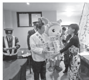
「飲んだら乗るな」を徹底！

飲酒運転撲滅月間期間中の12月8日、吉野川市長、阿波吉野川警察署長、吉野川市交通安全協会会長、会員など約10人が、吉野川市公式キャラクターのピッピーと共に鴨島町の飲食店を訪問しました。 「飲酒運転撲滅」と書かれたのぼりを手に、飲食店の店主にハンドルキーパー推進店指定書の交付や、反射材などの交通安全啓発グッズを手渡し、飲酒運転撲滅と安全運転を呼びかけました