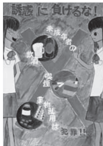
鴨島東中 清水 咲里