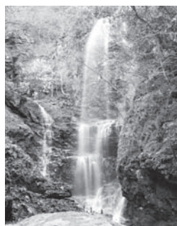
美郷の母衣暮露滝

美郷地域の豊かな自然環境や、地域に根ざした伝統・文化などの地域資源を有効活用し、都市住民との交流人口の増加や地域の特性を生かした産業の振興により地域経済の活性化を図り、地域住民が誇れる魅力的なまちづくりを行う必要があります。