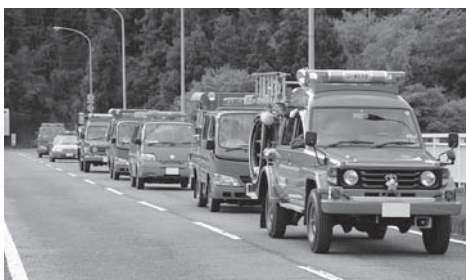
防火パレードに出動した消防車

平成27年度全国統一防火標語は、「無防備な 心に火災が かくれんぼ」です。空気が乾燥し、火災が発生しやすい季節を迎えます。一人一人が火災予防に対する意識を持つことにより、火災による悲惨な事故や貴重な財産の損失を防ぎ、「火災に強いまちづくり」をめざしましょう。