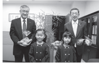
園児の皆さん、ありがとう！