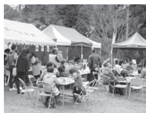
大勢の来客でにぎわいました