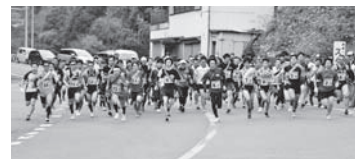
スタート直後の様子

12月6日、美郷地域一円で、第39回吉野川市美郷一周駅伝が開催されました。県内の67チーム402人が参加し、6区間約20kmでタスキをつなぎ健脚を競いました。