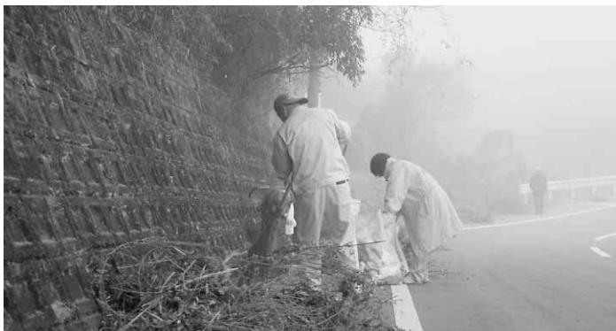
(アドプトプログラムによる清掃作業)

また、吉野川というネームバリューを活用し、阿波和紙、梅、焼き肉のたれ、蜂蜜などの産物について、新たなブランドを創設し、全国に向けPRしていきたいと考えています。