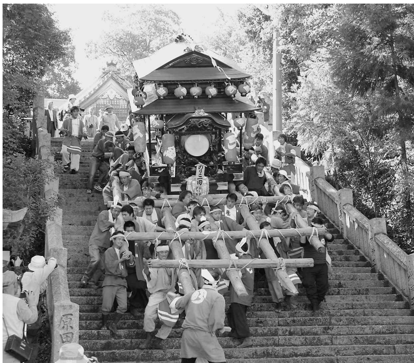
(川田八幡神社秋祭り)

時には自然と対峙し、時には睦みながら、まちづくりの歴史を刻んできました。 吉野川市に集った3町1村が、それぞれ育んできた歴史や文化など、それぞれの地域の特性を活かしながら、ともに一つになったメリットを最大限に活用し、市民の皆さん一人ひとりが主役となって次の世代に夢のある未来を引き継