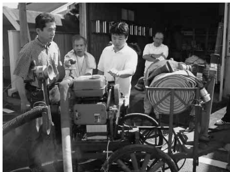
(西郷自主防災組織の防災訓練)

先般の台風23号への対応において、災害時の様々な課題が明らかになりました。今後作成する「吉野川市地域防災計画」に、その改善策を盛り込んでいく方針です。