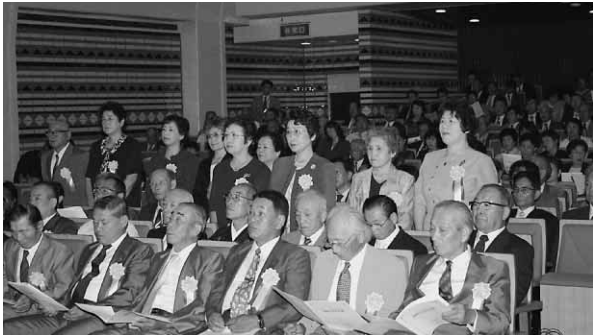
8月29日、鴨島町閉町記念式典