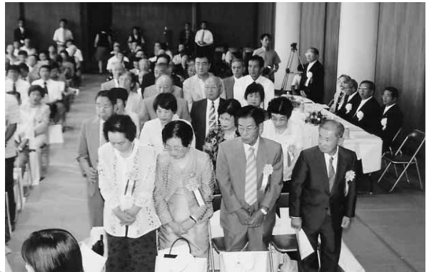
8月29日、川島町立町50周年・閉町記念式典、第20回社会福祉大会