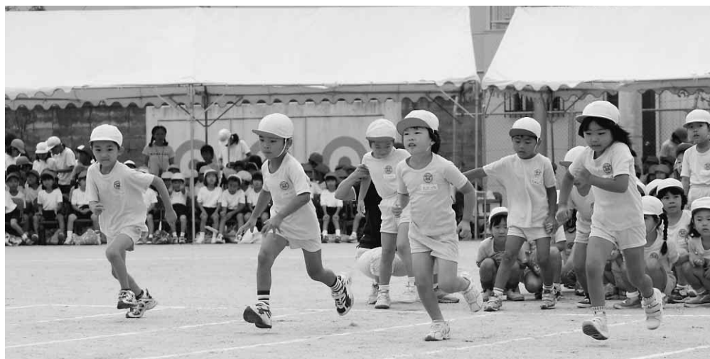
◀ 吉野川市スタート