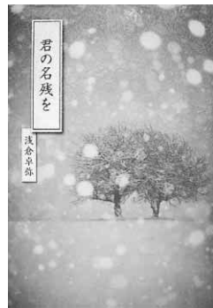
君の名残を 浅倉卓弥

『サウダージ』垣根涼介/文藝春秋 『夜のピクニック』恩田陸/新潮社 『君の名残を』浅倉卓弥/宝島社